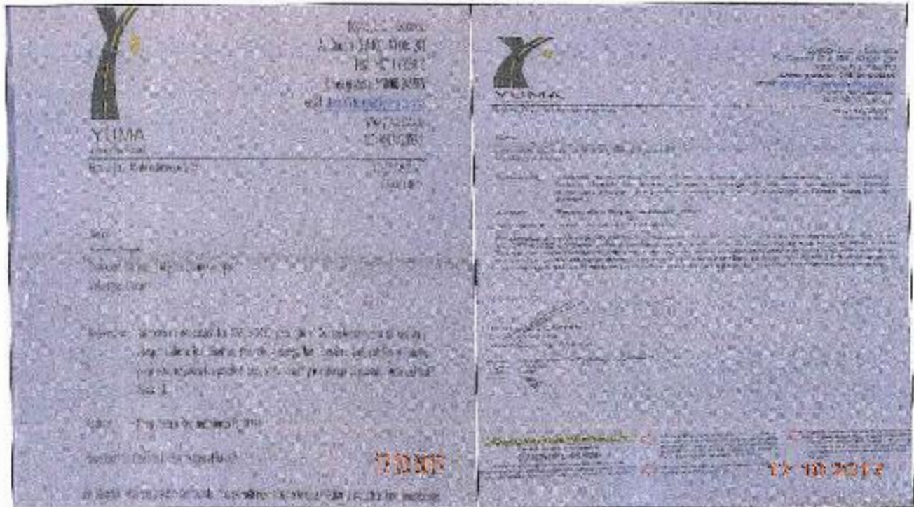
EDICTOS DE LA R_18194 YC-CRT-60832

Lugar: Oficina de Atención Al Usuario, Boacónia